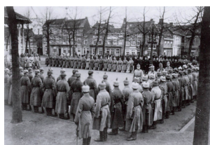
Troepenschouwing in Lokeren

Stadsarchief Stadsarchief, Torenstraat 1A, 9160 Lokeren (13u30-17u30) T: 09 340 50 61 - E: stadsarchief@lokeren.be - www.lokeren.be