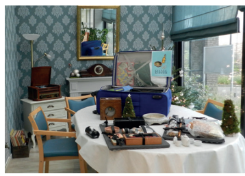
Keuvelkoffer Vrije Tijd

Gemeentebestuur Stekene i.s.m. Erfgoedcel Waasland, Zorg Stekene Zorg Stekene, Kerkstraat 14a, 9190 Stekene (14u-17u) www.stekene.be