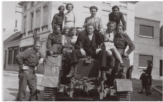
Poolse bevrijders, Stekene, 1944