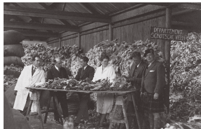
Haarsnijderij Epouse Jacobs, Lokeren