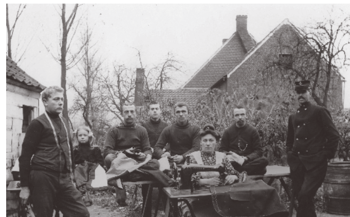
Naaiatelier, Burcht, 1905 - Foto: John Tulpinck