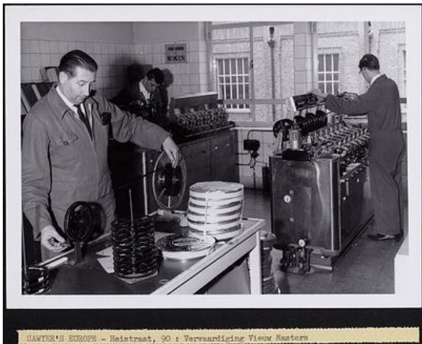
SAWYER'S EUROPE - Heistraat, 90 t. Vervaardiging Vlees Maats