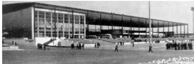
Paviljoen van het Vervoer 28

Onder de noemer “Zee- en Riviervervoer” werd alles wat enigszins betrekking had tot het vervoer te water (zowel zee- als binnentransport) en de daarmee in betrekking zijnde nijverheden gegroepeerd. De verschillende klassen die aan deze afdeling meewerkten, streefden er vooral naar het economische, sociale en humane belang van het zeewezen te doen uitkomen. De afdeling bevond zich in het Paviljoen van het Vervoer , waar zich ook nog de afdelingen “Luchtvervoer” en “Vervoer te Land” bevonden, naast een tentoonstelling van spoorwegmaterieel.