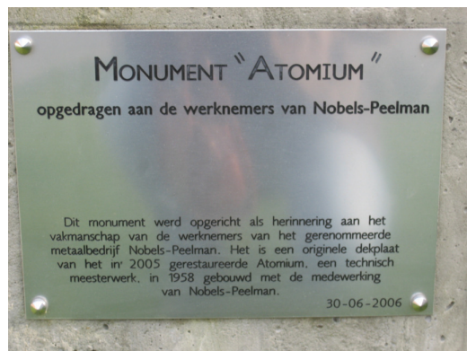
Monument "Atomium" in de Nijverheidsstraat te Sint-Niklaas 6