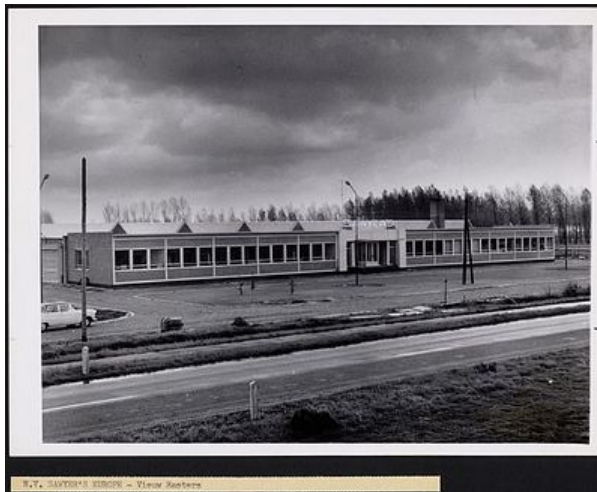
S.T. SAWYER'S EUROPE - Vleesfabriek