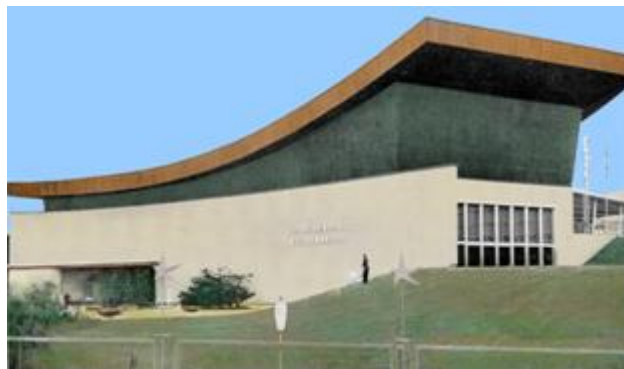
Paleis van de Internationale Samenwerking 13

Daarnaast bouwden zij ook het Paleis van de Internationale Samenwerking . 12 Dit paleis lag in de Internationale Afdeling, samen met de paviljoenen van ondermeer de Verenigde naties en de Benelux. De paviljoenen van deze sectie vormden een groep rond het ‘ Plein der Internationale Samenwerking ’. Het gebouw had een gebogen, asymmetrische façade. In het paviljoen waren een aantal ruimtes waar de bezoeker meer kon te weten komen over de internationale organisaties en de thema’s waarrond zij samenwerkten.